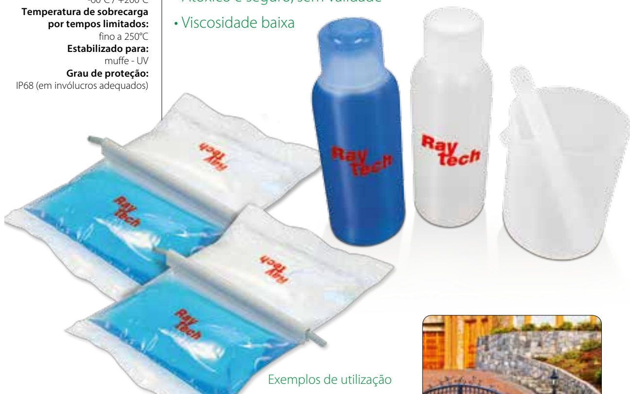
Exemplos de utilização